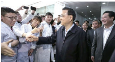
李克强总理与吉林大学师生

首届中国“互联网+”大学生创新创业大赛总决赛于2015年10月19日至20日在吉林长春举行。中共中央政治局常委、国务院总理李克强对大赛作出重要批示。批示指出：大学生是实施创新驱动发展战略和推进大众创业、万众创新的生力军，既要认真学习扎实学习、掌握更多知识，也要投身创新创业、提高实践能力。中国“互联网+”大学生创新创业大赛，紧扣国家发展战略，是促进学生全面发展的重要平台，也是推动产学研用结合的关键纽带。教育部门和广大教育工作者要认真贯彻国家决策部署，积极开展教学改革探索，把创新创业教育融入人才培养，切实增强学生的创业意识、创新精神和创造能力，厚植大众创业、万众创新土壤，为建设创新型国家提供源源不断的人才智力支撑。