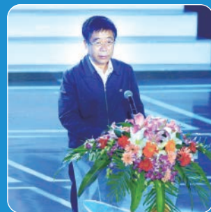
教育部部长陈宝生

第二届大赛于2016年3月启动，10月13-15日，总决赛在华中科技大学举行。学生报名项目及参与学生人数分别是首届大赛的3.3倍、2.7倍，掀起了大学生创新创业的新热潮。最终产生冠、亚、季军4名、金奖32个、银奖115个和铜奖448个。