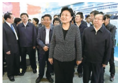
刘延东副总理在华中科技大学

2016年10月14日，中共中央政治局委员、国务院副总理刘延东莅临华中科技大学，接见第二届中国“互联网+”大学生创新创业大赛获奖学生、指导教师和专家评委代表。她强调，要按照党中央、国务院决策部署，加快实施创新驱动发展战略，深化高校创新创业教育改革，促进学生全面发展，推动产学研用结合，为促进大众创业万众创新和创新型国家建设提供有力支撑。